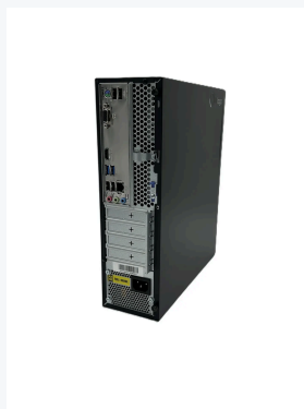
Panel de conexiones trasero: HDMI · VGA · USB · RJ45 Gigabit · audio HD · fuente 300W